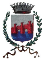
Ponte sul Mincio